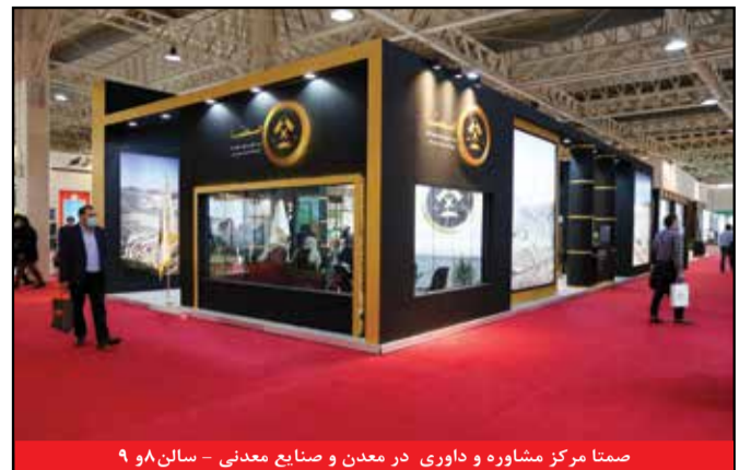
صنما مرکز مشاوره و داوری در معدن و صنایع معدنی - سالن ۸ و ۹