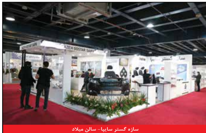
سازه گستر سایبا - سالن میلاد