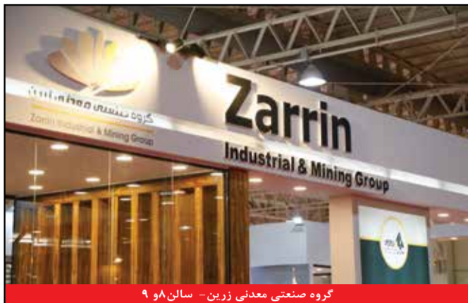
گروه صنعتی معدنی زرین - سالن ۸ و ۹